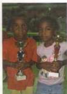
LA COURSE DE L'AVENIR : nos petits vainqueurs ont déjà dans l'âme, une étoffe de grands champions...

MERCREDI 24 JUIN LA COURSE PÉDESTRE DE L'AVENIR ET LA COURSE CYCLISTE DE LA ST JEAN-BAPTISTE