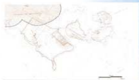
Futur ZAC de Montsinery