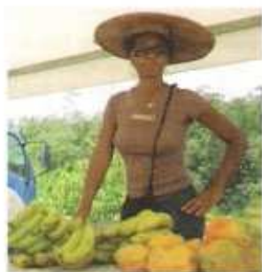
Marché rural de tonnégrande