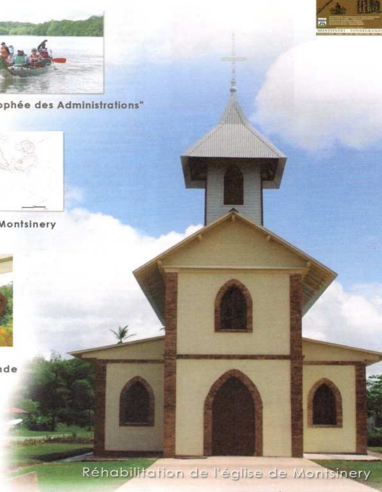
Réhabilitation de l'église de Montsinery