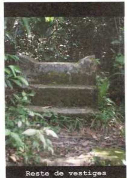
Reste de vestiges