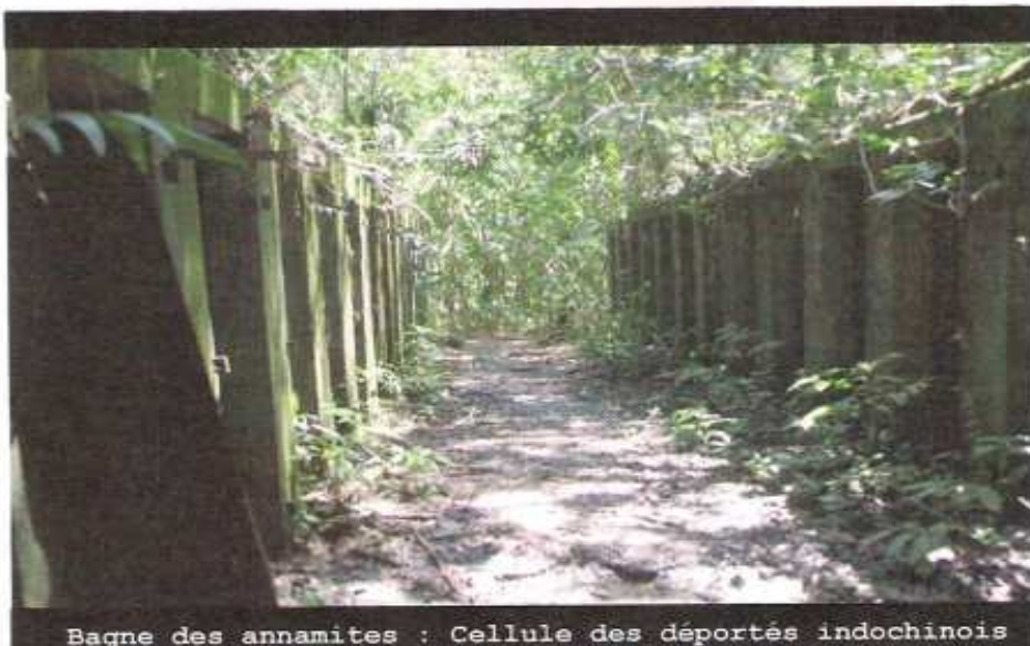
Baigne des annamites : Cellule des déportés indochinois

Création de l'association des descendants de déportés indochinois et adoption du projet pour la restauration du baigne des annamites de la crique anguille par le conservatoire du littoral .