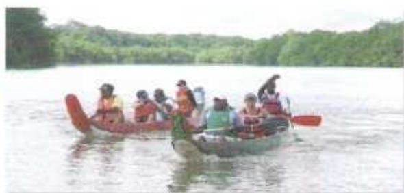
"Cinquième Trophée des Administrations"